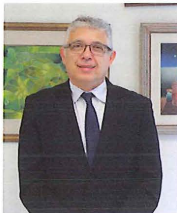
Desembargador atuou em Pato Branco de 1994 a 1996

O 1º vice-presidente do TJ-PR também comentou sobre o concurso para cargos técnico aberto em 2017 e que ficou suspenso,