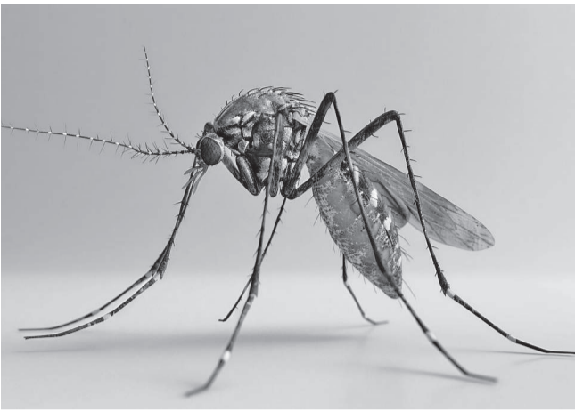
O mosquito da dengue atacou 94% dos municípios do PR.

Os óbitos ocorreram entre 3 de março e 28 de abril. São dez homens e 16 mulheres com idades entre 14 e 93 anos, residentes em 17 municípios: Piraquara, Saudade do Iguaçu, Dois Vizinhos, Francisco Beltrão, Marmeleiro, Nova Esperança do Sudoeste, Planalto, Santa Izabel do Oeste, Boa Vista da Aparecida, Cascavel, Lindoeste, Nova Aurora, Três Barras do Paraná, Ivaté, Amaporã, Sabáudia, Cornélio Procópio. Dezesete destas pessoas tinham comorbidades. A Regional com mais ca-