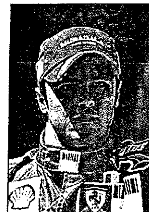
• Massa confiante na vitória

A distância para a McLaren, que já abriu 20 pontos na liderança do Mundial de Construtores, não desanima a Ferrari. Mesmo porque a equipe italiana tem boas perspectivas para o GP do Canadá, numa pista onde seu carro teoricamente pode render mais do que o do rival. "Estaremos fortes em Montreal", avisou o diretor-esportivo da Ferrari, Stefano Domenicali.