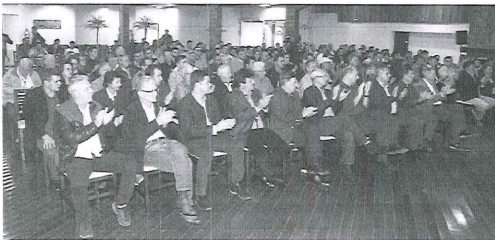
Cerimônia de abertura contou com a presença de lideranças e representantes de entidades locais