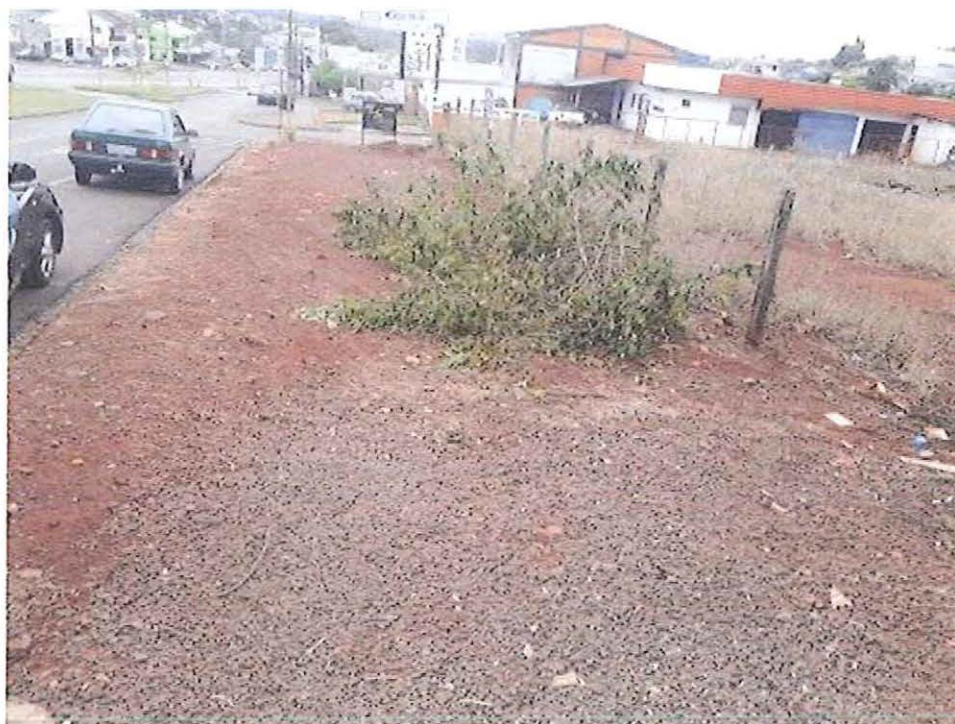
Foto: Marginal da Avenida Tupi