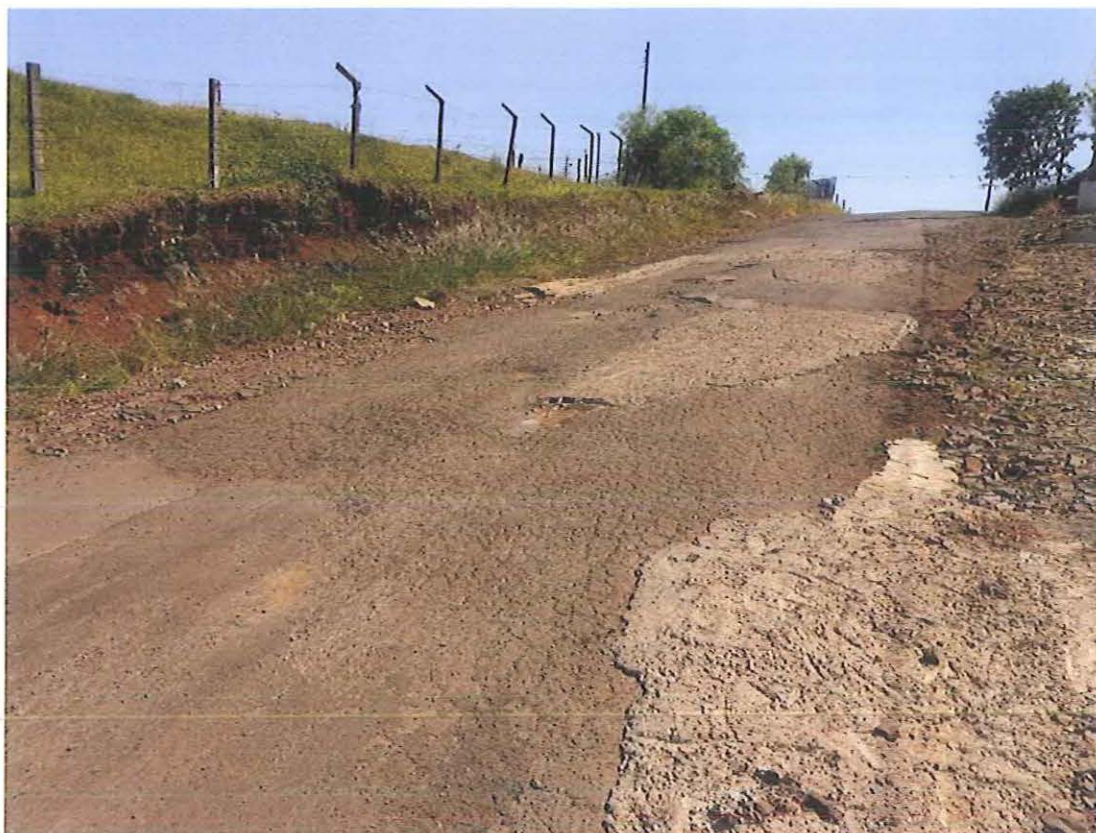
Rua Ledovino Fazolin, Bairro Dal Ross.

PROTOCOLO GERAL 642/2020 Data: 16/03/2020 - Horário: 10:15 Legislativo - REQ 404/2020