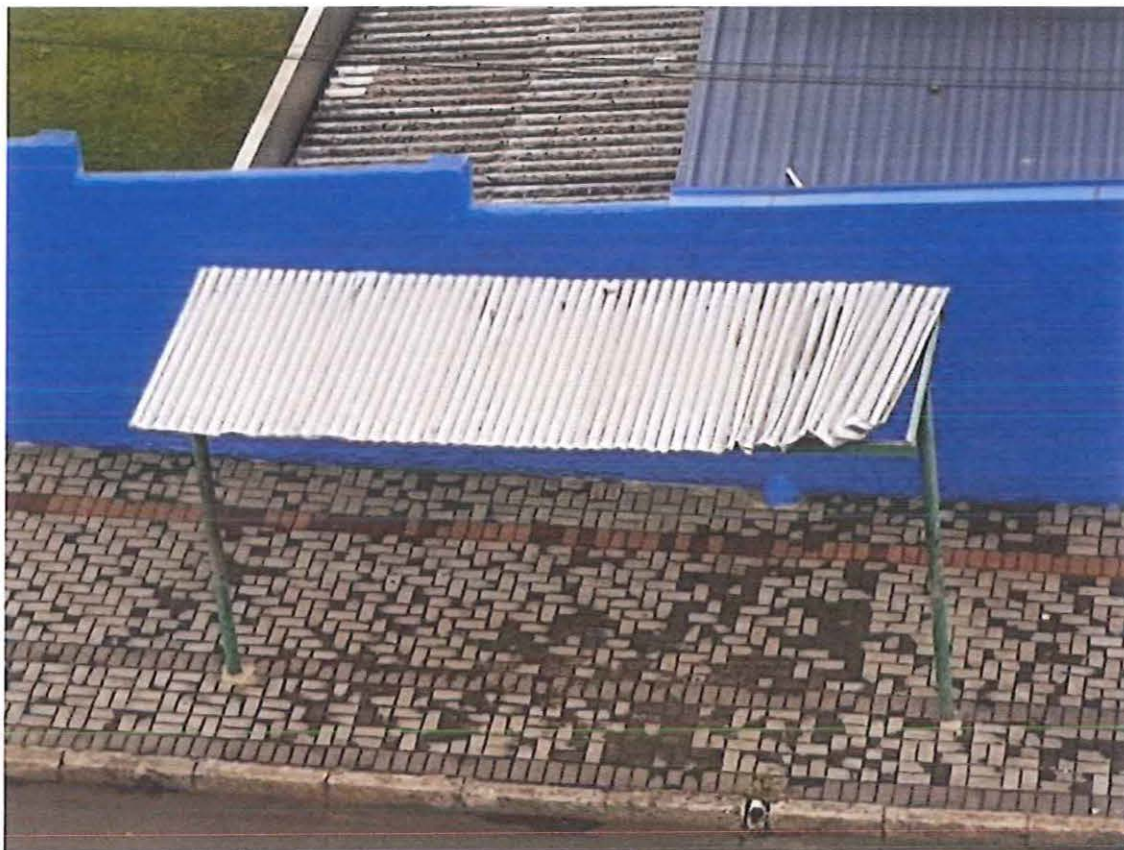
Foto: abrigo do transporte coletivo, Rua Aimoré, em frente ao nº 312.

PROTOCOLO GERAL 1304/2020 Data: 25/05/2020 - Horário: 09:23 Legislativo - REQ 806/2020