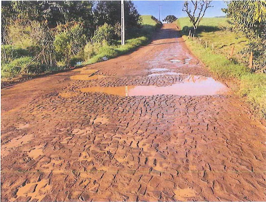
Rua Mohamed Awada - Bairro São João

PROTOCOLO GERAL 2023/2020 Data: 14/07/2020 - Horário: 12:08 Legislativo - REQ 1283/2020