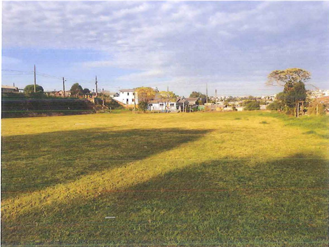
Foto: espaço público do Bairro São Roque