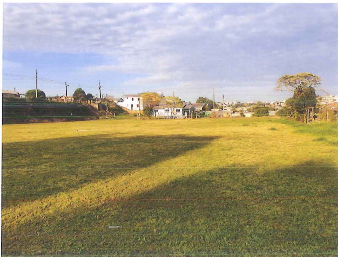
Foto: espaço público do Bairro São Roque

PROTOCOLO GERAL 2097/2020 Data: 17/07/2020 - Horário: 11:24 Legislativo - REQ 1325/2020