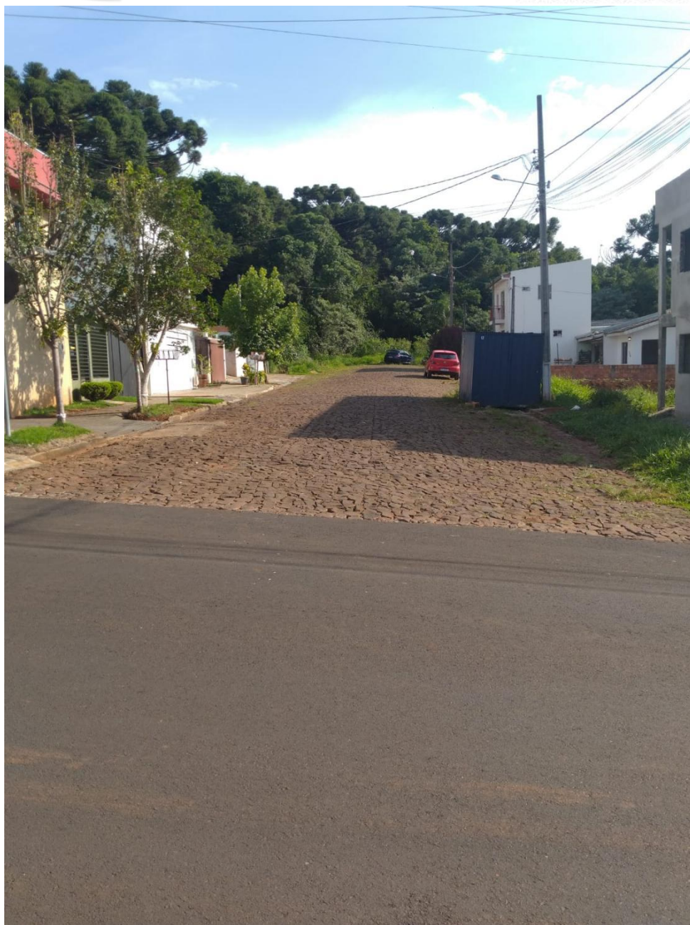
Rua Domingos de Matos

PROTOCOLO GERAL 852/2022 Data: 08/04/2022 - Horário: 17:07 Legislativo - IND 104/2022