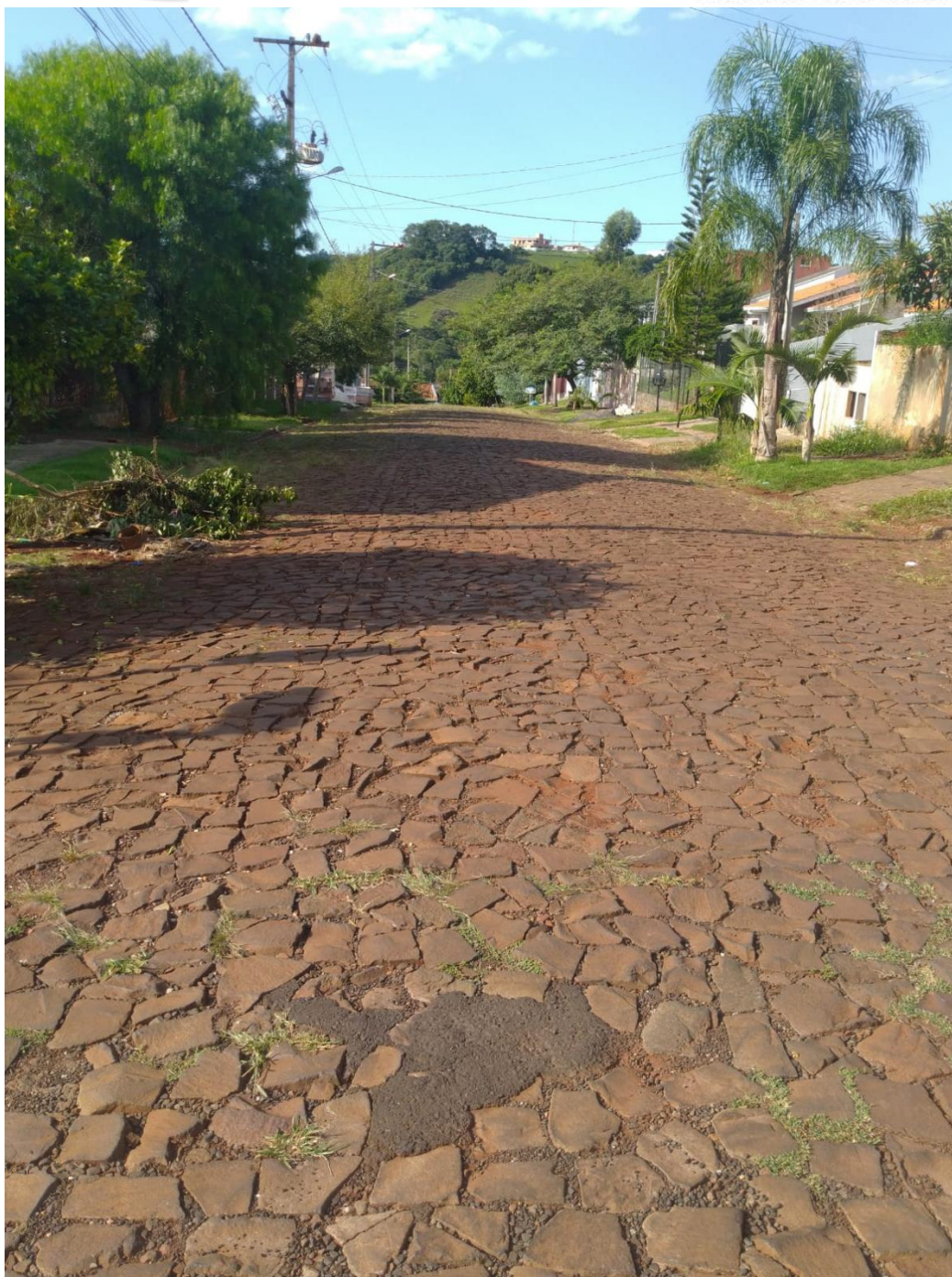
Rua Domingos de Matos

PROTOCOLO GERAL 852/2022 Data: 08/04/2022 - Horário: 17:07 Legislativo - IND 104/2022