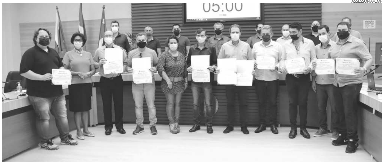
A imprensa de Pato Branco recebeu a Moção de Aplauso na tarde dessa quarta-feira (17)